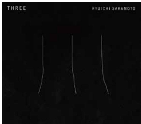
坂本龍一「THREE」 発売日：2012年10月17日(水) 商品番号：RZCM-59189 定価：3,500円(税込)