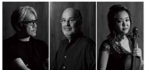
坂本龍一(ピアノ)、 ジャケス・モレレンバウム(チェロ)、 ジュディ・カン(ヴァイオリン)

2011年ヨーロッパでおこなわれ大好評を博した「Ryuichi Sakamoto Trio Tour」のメンバー、坂本龍一(ピアノ)、ジャケス・モレレンバウム(チェロ)、ジュディ・カン(ヴァイオリン)によって開催される2012年冬の日本・韓国ツアー。今回のコンサートに先駆けてリリースされるアルバム「THREE」を携えて開催されるコンサートでは、10周年記念祭の総合アーティストック・ディレクターである坂本龍一氏の新旧織り交ぜた名曲が、YCAMが誇るハイクオリティな音響環境で演奏されます。